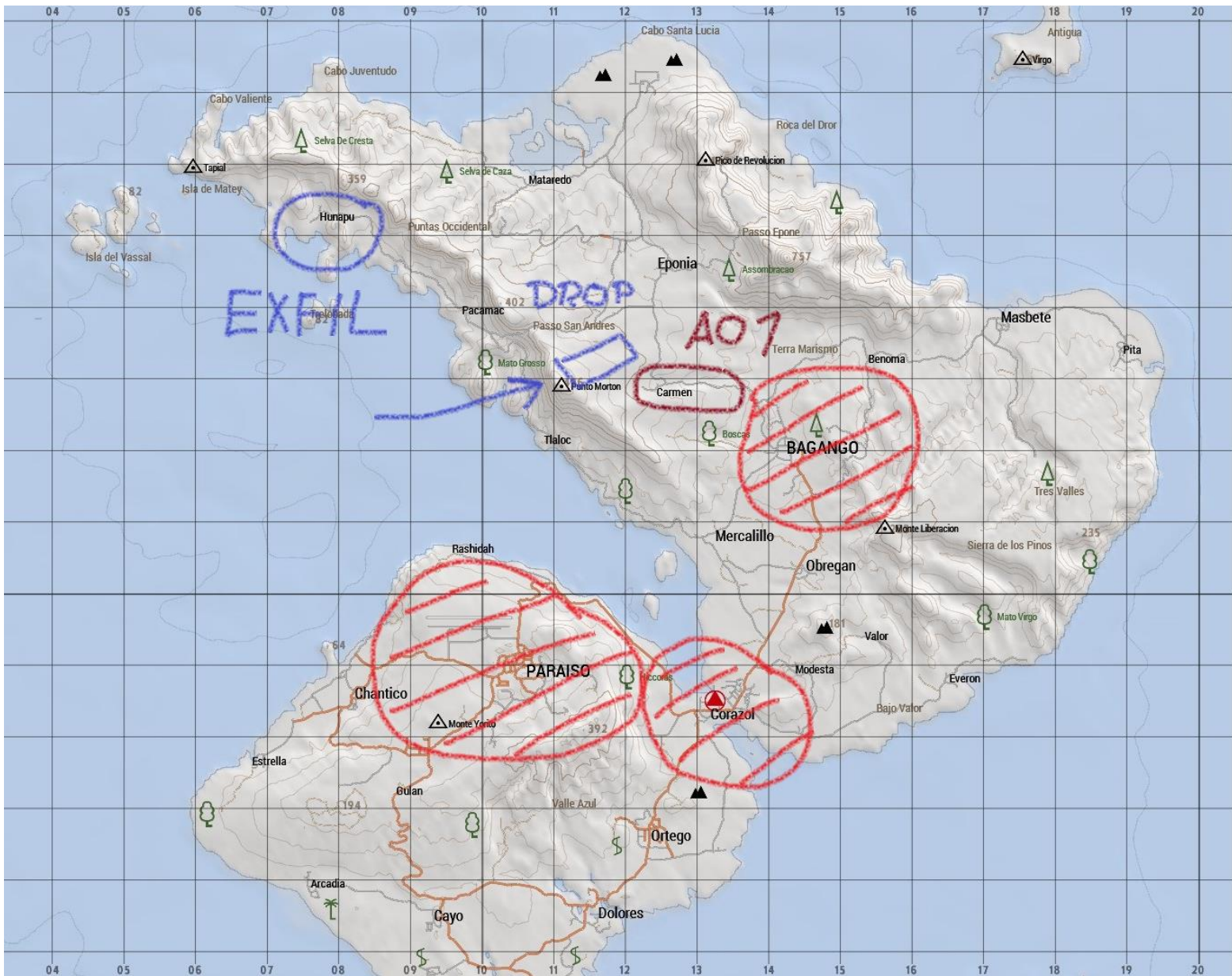
Mapa ostrova Sahrani