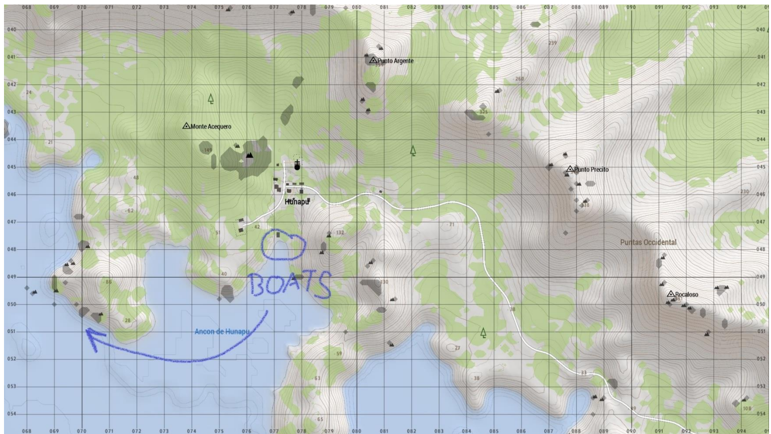
Primární exfil – ukryté lodě v přístavu Hunapu